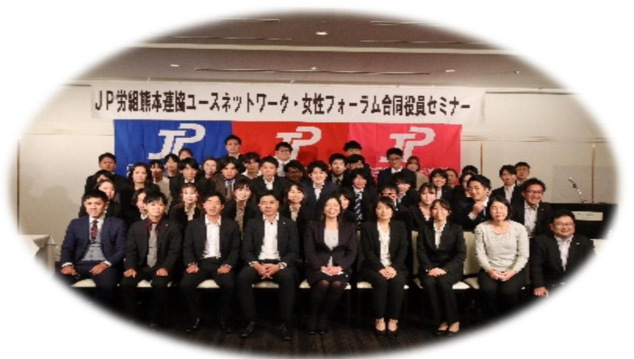
ユース・女性合同役員セミナー