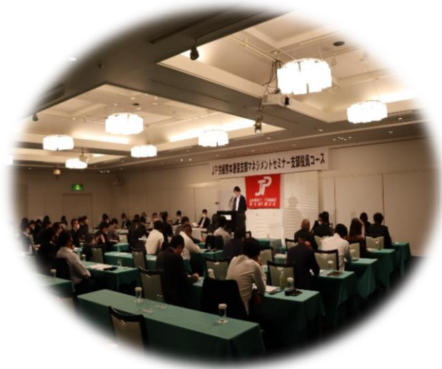
支部マネジメントセミナー役員コース